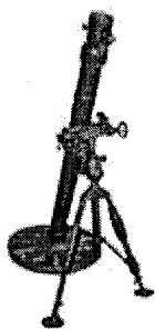
Миномет 82 мм

И в конце я хотел бы сказать: «Я очень сильно горжусь своими прадедами».