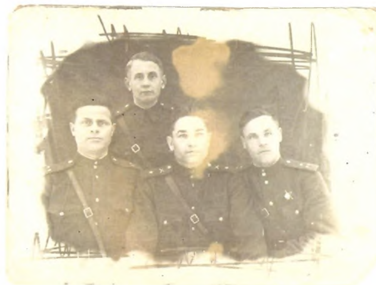
ФРОНТ, 1943 ГОД

В августе 1943 года уже майор и кавалер ордена Отечественной войны I и II степени, мой дедушка закончил Высшую Военную школу и, приняв под командование 783 артиллерийский полк 260 стрелковой дивизии продолжал громить врага на Западном фронте.